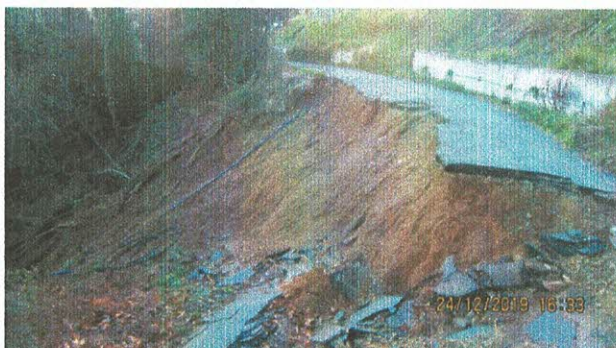
Frana in via San Nazario a Savona. Così dal 2019.

LE BOMBE D'ACQUA – si dice che attualmente piove di meno. Ma forse è più corretto dire che piove diversamente, ovvero la pioggia che cinquant'anni or sono scendeva distribuita in dodici mesi, oggi scende, tutta concentrata e quindi devastante, in due o tre occasioni, per un tempo più lungo, da cui il nuovo termine "bombe d'acqua"